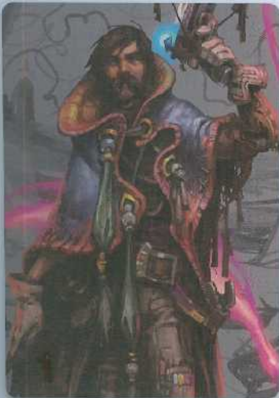
Artwork © Kory Lynn Hubbell