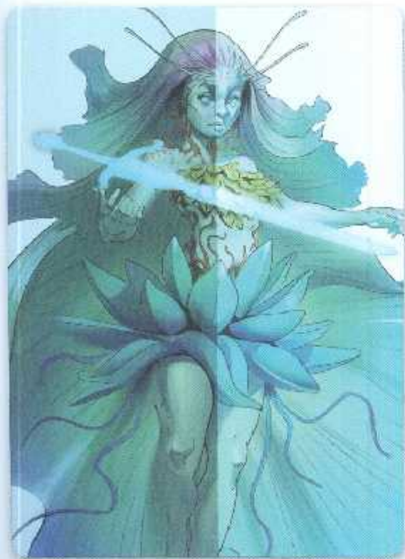
Artwork © Antonio Stappaerts