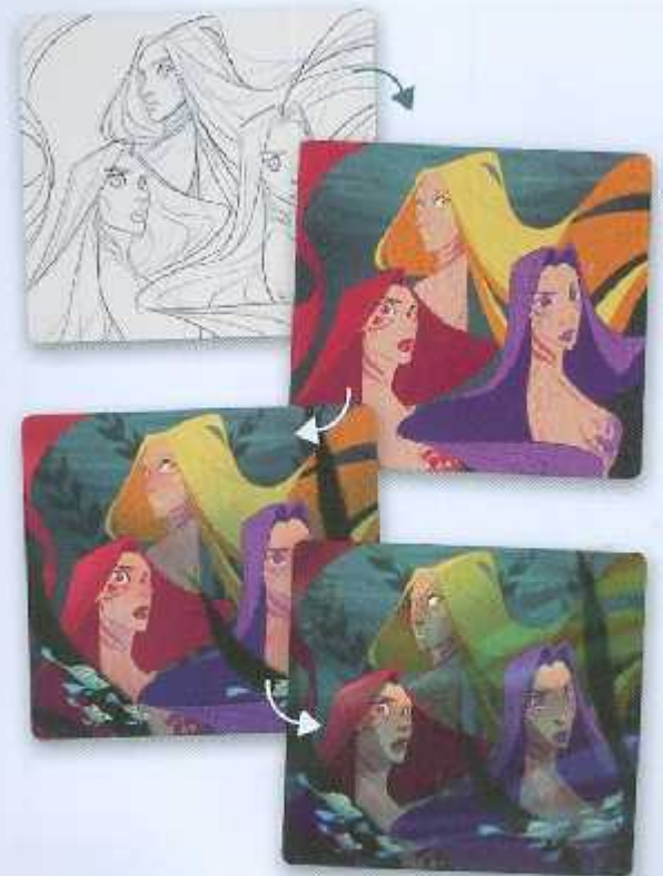
Artwork © Lisanne Koeteew