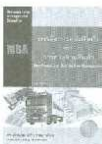
MBA-15 ราคา 500.-