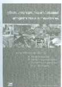
LSCM 01-06 ราคา 150.-