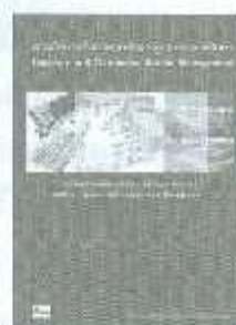
MBA 11 ราคา 400.-