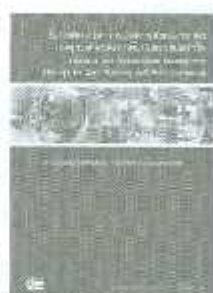
LSCM 01-02 ราคา 250.-