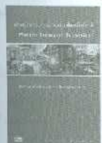
LSCM 03-02 ราคา 250.-