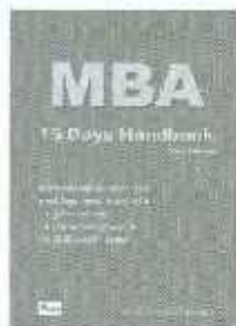
MBA ราคา 400.-