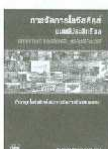
LSCM 01-05 ราคา 400.-