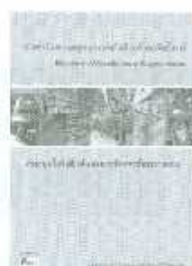
LSCM 02-02 ราคา 250.-