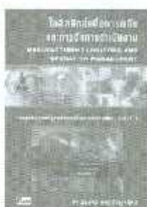
MBA 07 ราคา 400.-