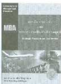
MBA-14 ราคา 500.-