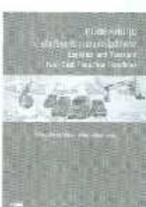
LSCM 03-04 ราคา 270.-