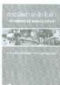
LSCM 02-01 ราคา 200.-